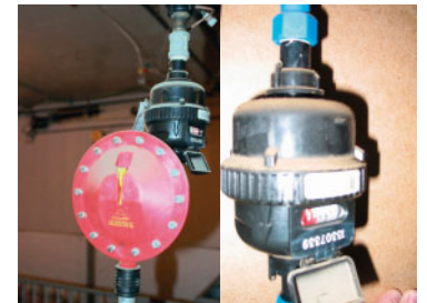
Figure 5 : Compteur d'eau « mécanique » installé à chaque case

Des compteurs d'eau (mécaniques) avec cadran indicateur ont été installés à chaque abreuvoir, la précision de mesure étant de 0,5 litre (figure 5). La lecture des compteurs mécaniques a été faite et enregistrée quotidiennement avec l'heure de lecture.