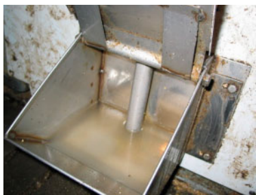
Figure 4 : Abreuvoir de type bol avec couvercle contrôlé avec valve VHR

confort en sol plein (1,22 x 1,45 m) est située au centre de la case. Les nourrisseurs et les abreuvoirs sont installés en bout de case du côté du couloir central. Quatre types d'abreuvoirs ont été comparés dans le cadre de ce projet.