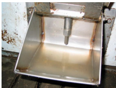
Figure 3 : Abreuvoir de type bol avec couvercle muni d'un bouton-poussoir