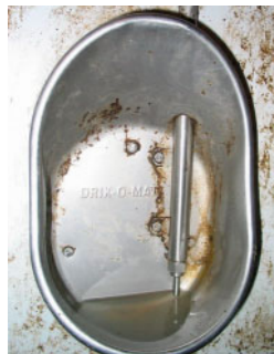
Figure 2 : Abreuvoir de type Drik-O-Mat avec bouton-poussoir

sciences animales de Deschambault (CRSAD) dans le bâtiment appelé « Unité de testage et d'expérimentation en alimentation porcine (UTEAP) » (figure 1). Pour cette expérience, 39 cases de 1,45 x 4,27 m ont été utilisées, logeant 7 porcs chacune. Une case a été réservée pour isoler les porcs malades. Les sols sont de type caillebotis partiel et la zone de