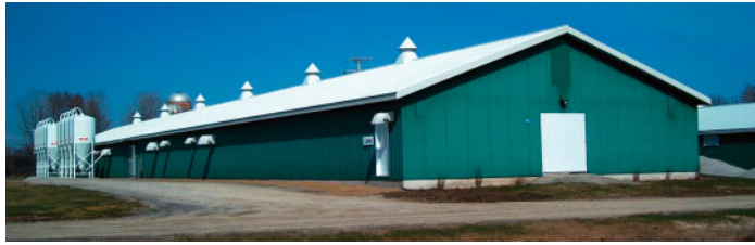
Figure 1 : Unité de testage et d'expérimentation de Deschambault

sciences animales de Deschambault (CRSAD) dans le bâtiment appelé « Unité de testage et d'expérimentation en alimentation porcine (UTEAP) » (figure 1). Pour cette expérience, 39 cases de 1,45 x 4,27 m ont été utilisées, logeant 7 porcs chacune. Une case a été réservée pour isoler les porcs malades. Les sols sont de type caillebotis partiel et la zone de