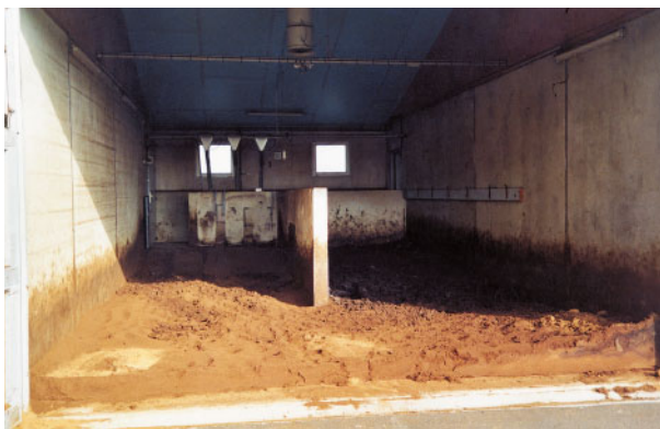
Sciure en fin d'engraissement