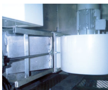
Photo 3 : L'installation de ventilateur ne se justifie pas pour des transports de moins de 8 heures, sans arrêts prolongés

Quelle que soit la saison, pendant un transport de plus de 8 heures, avec tous les volets ouverts, les débits d'air sont supérieurs à 88m 3 /h/porc à l'arrêt et à 178 m 3 /h/porc lors des phases de transport (Chevillon et al. 2002, Cf. tableau ci-dessous).