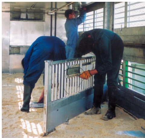
Photo 1 : Installation des appareils de mesure d'ambiance (T°C, humidité, taux de CO 2 , vitesse d'air au niveau des porcs dans un camion à 3 niveaux)

Lors du transport, la température ambiante mesurée au niveau des porcs (à 70 cm de hauteur) correspondait à la température extérieure, compte tenu du fort renouvellement d'air (vitesses d'air de 2 à 3 m/s).